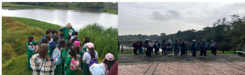
Estrategias de Educación ambiental implementadas en el D.C

Con respecto a las actividades desarrolladas en los Humedales del D.C, desde los equipos de Caminatas Ecológicas y Aulas Ambientales se ejecutan recorridos en estos ecosistemas, que buscan promover su conservación, cuidado y generar experiencias para el reconocimiento del territorio y la biodiversidad presente en estos.