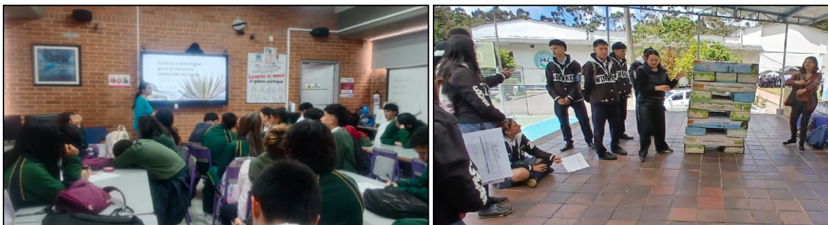
Estrategias de Educación ambiental implementadas en el D.C

La Secretaría Distrital de Ambiente a través de la Oficina de Participación, Educación y Localidades, desarrolla acciones de educación ambiental acorde con las estrategias definidas en el Decreto 675 de 2011 y lo establecido en el plan de acción de la Política Pública Distrital de Educación Ambiental aprobado por el CONPES 13 de 2019. Estas acciones se ejecutan con comunidad en general, empresas e instituciones educativas públicas y privadas, logrando una cobertura efectiva en las 20 localidades del Distrito, vinculando 253.838 participantes durante la vigencia 2024, como se relaciona en la Tabla 5 Personas beneficiadas en las estrategias de educación ambiental por localidad.